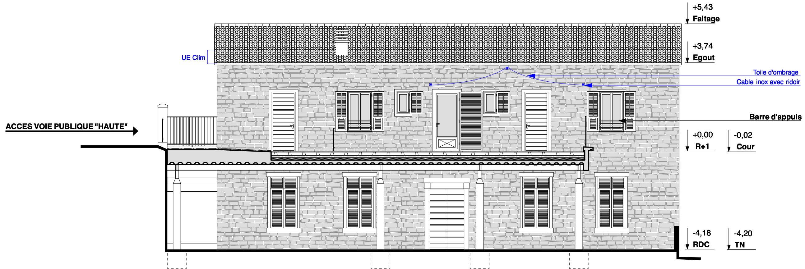
FACADE SUD - PROJET Echelle: 1/100ème