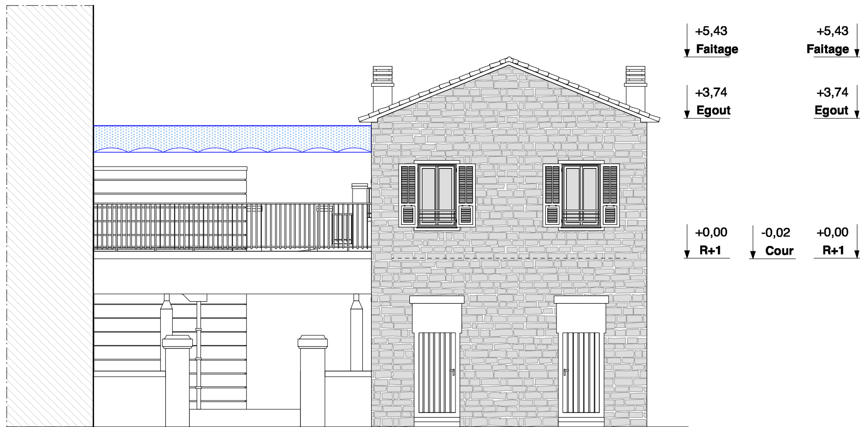
FACADE EST - PROJET Echelle: 1/100ème